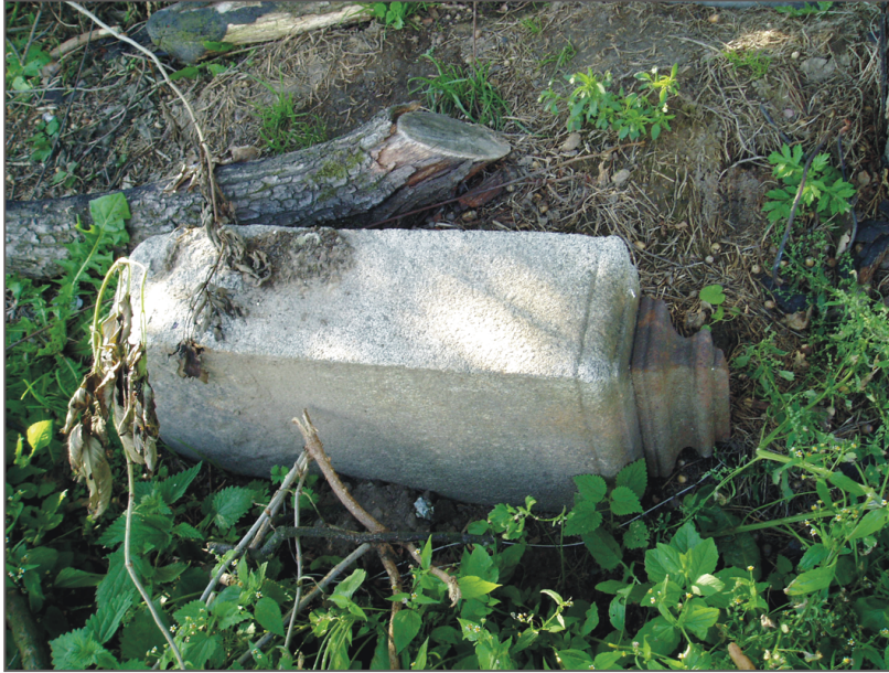
A. Bobrowice. Cokół zrzucony na obrzeżu cmentarza. Fot. K. Kontowski, 2007