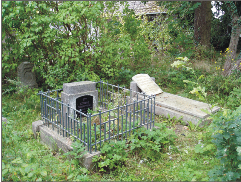
A. Radosław. Zachowane nagrobki z końca lat 40. XX wieku. Fot. K. Kontowski, 2007