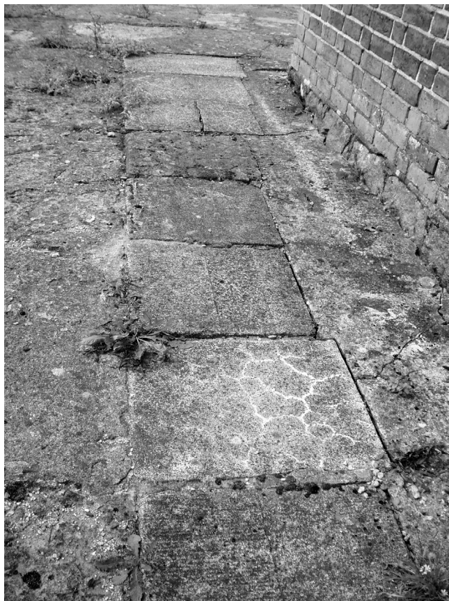
Ryc. 1. Boleszewo. Płyty cmentarne włożone w drogę procesyjną wokół kościoła. Fot. K. Kontowski, 2007

Układ kwater został zatarty, a nagrobki zniszczone. Z dawnego cmentarza zachowała się płyta z czarnego granitu pod krzyż ustawiona po południowej stronie cmentarza oraz kilka płyt wmurowanych w opaskę wokół kościoła, odwróconych napisami do dołu (ryc. 1). W niewielkim stopniu zachował się także drzewostan, w tym: pomnikowe dęby szypułkowe, lipa drobnolistna, usychający jesion zwisły, żywopłot bukowy. W podrostach śnieguliczka, głóg, jeżyny.