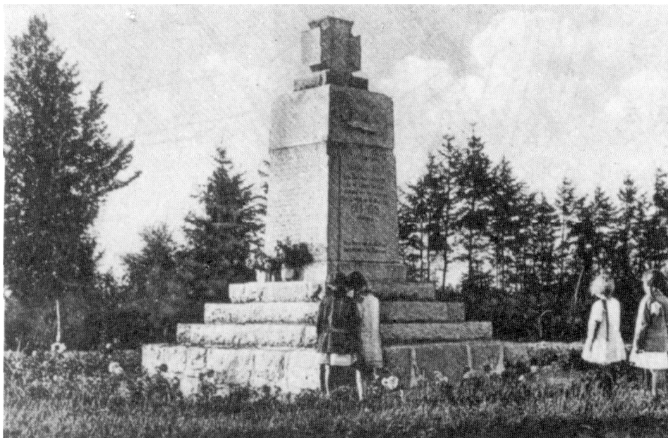
Ryc. 8. Warszkowo. Pomnik poległych w czasie I wojny światowej (Pantel 1989: 828)

Obecnie w tylnej części cmentarza znajduje się wysypisko śmieci (dachówki, cegły, trociny...).