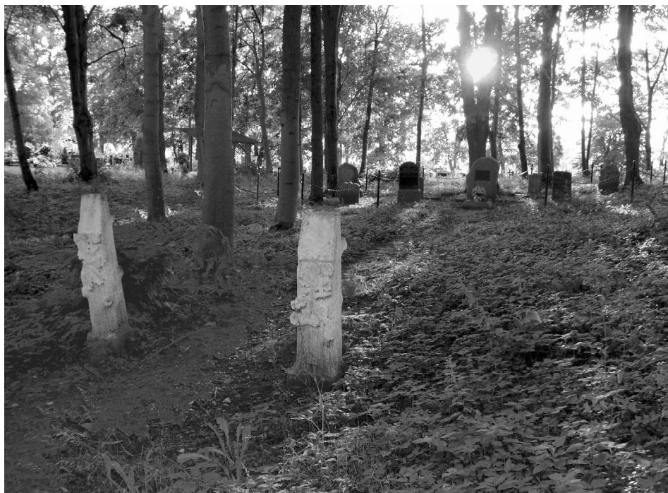
Ryc. 11. Żukowo Sławieńskie. Lapidarium. Fot. K. Kontowski, 2007