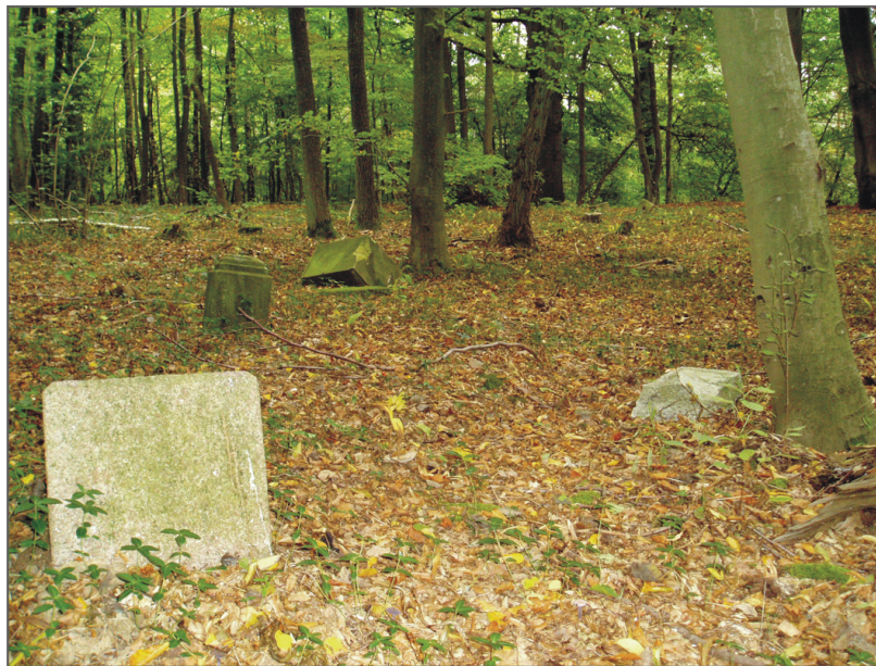
B. Kwasowo. Dawny cmentarz ewangelicki. Fot. K. Kontowski, 2007