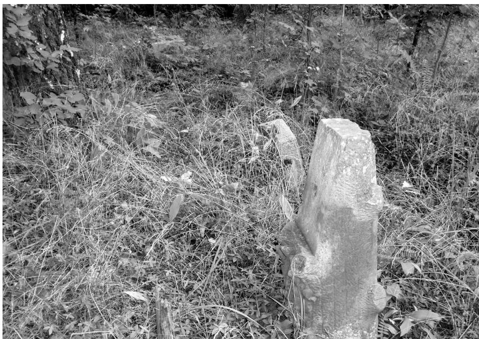
Ryc. 9. Warszkwko. Cokoły „pulpitowe” zachowane na cmentarzu ewangelickim. Fot. K. Kontowski, 2007

Zachowało się dużo fragmentów nagrobków, takich jak: betonowe omurowania mogił, cokoły pod żeliwne krzyże z naturalnego i sztucznego kamienia, cokoły pod tablice w formie ściętego pnia dębu oraz cokoły dekorowane plastycznym motywem wieńca przewiązanego kokardą, z wyrytym napisem „Śpij w spokoju” (ryc. 9).