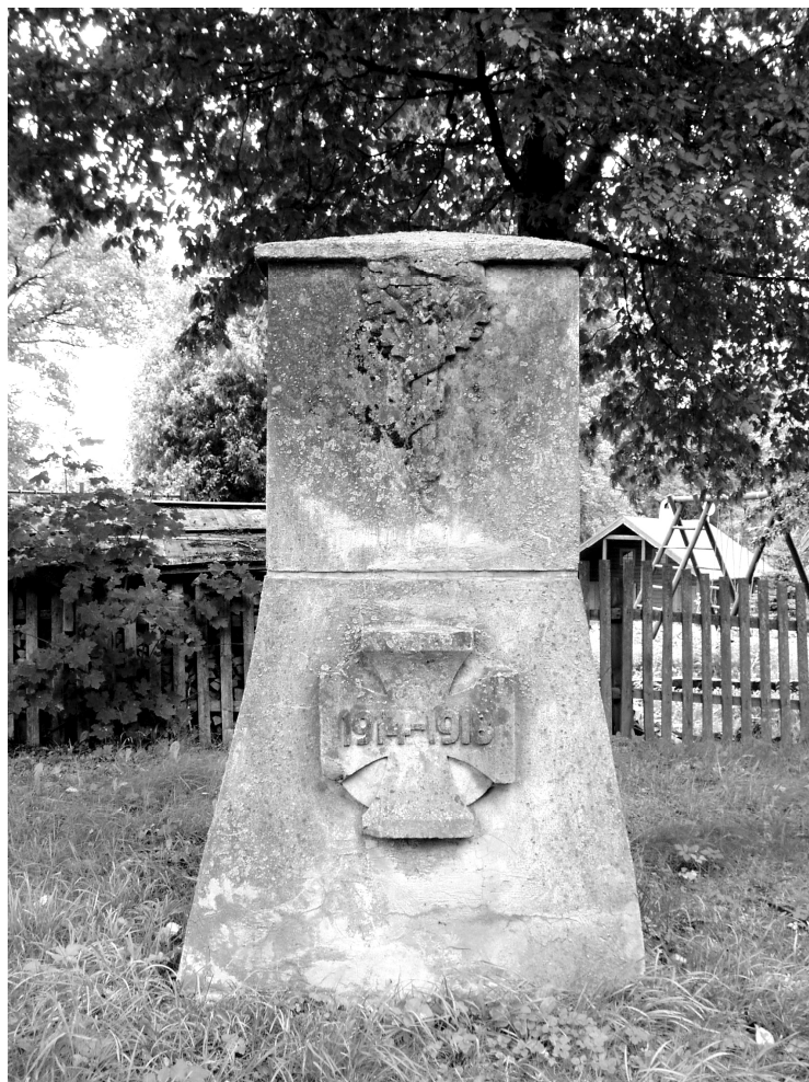
Ryc. 5. Stary Kraków. Pomnik poległych na dawnym cmentarzu przykościelnym. Fot. K. Kontowski, 2007

Na cmentarzu występuje także cenny starodrzew: pomnikowe dęby, obrośnięte potężnym bluszczem, i lipa.