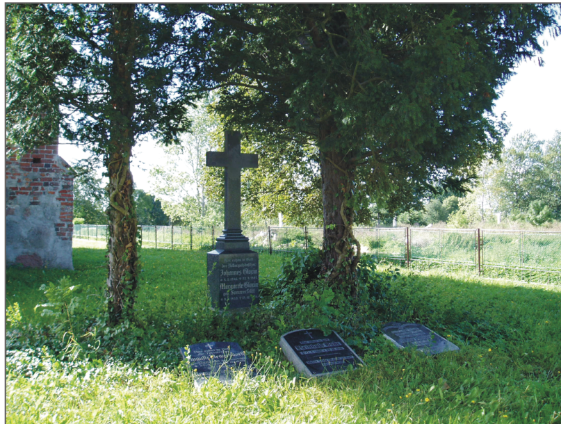
B. Rzyszczewo. Lapidarium przykościelne. Fot. K. Kontowski, 2007