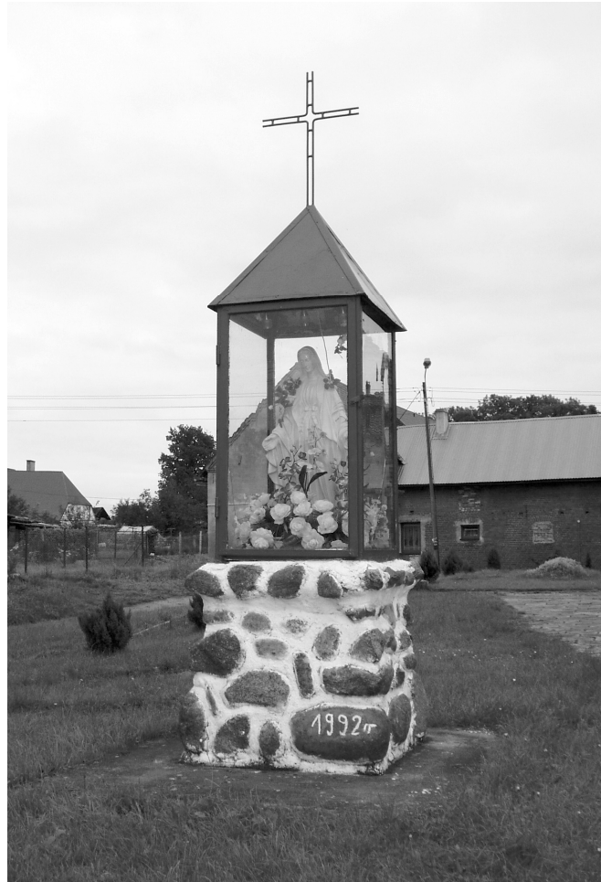
Ryc. 7. Tychowo. Cokół dawnego pomnika poległych wykorzystany jako podstawa kapliczki z figurą Matki Boskiej. Fot. K. Kontowski, 2007