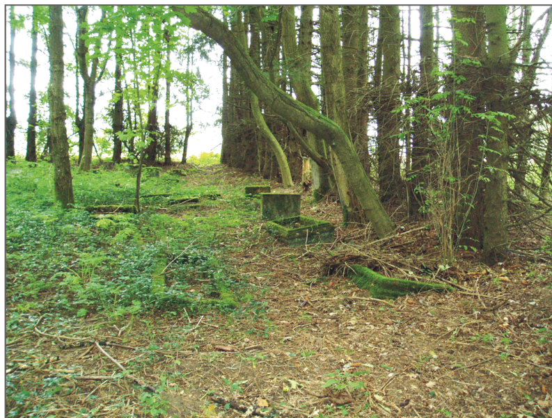
B. Tychowo. Fragment dawnego cmentarza ewangelickiego. Fot. K. Kontowski, 2007