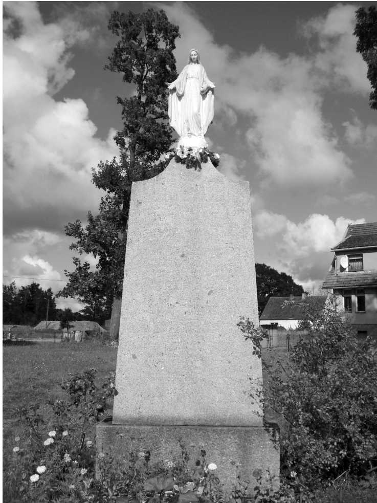
Ryc. 2. Rzyszczewo. Dawny pomnik poległych, obecnie kapliczka z figurą Matki Boskiej Niepokalanego Poczęcia.

XIX wieku na terenie płaskim. Pierwotnie niewielki, rozszerzony przypuszczalnie na początku XX wieku, współcześnie zajmuje 0,40 ha. Wcześniej podzielony był aleją. Od strony północno-wschodniej przylega do niego gospodarstwo rolne, od południowo-zachodniej boisko sportowe. Obecnie nieużytkowany, ze zniszczonym układem kwater i nagrobków, zaśmiecony. Przy południowo-zachodniej granicy istniała niewielka czworoboczna kaplica. Na jej fundamentach ustawiono kurnik. Zachował się jedynie cenny drzewostan: lipy, klony, jesiony i graby. Nagrobków brak.