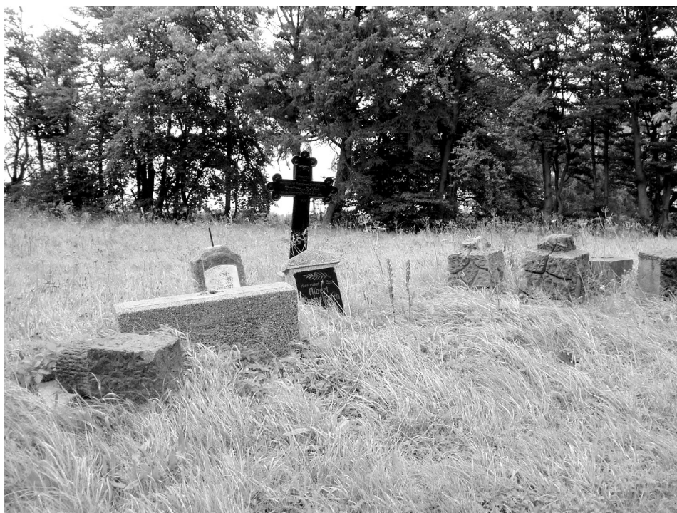
Ryc. 4. Sławsko. Zachowane fragmenty nagrobków na cmentarzu przykościelnym.

Na cmentarzu ustawiony jest graniasty, masywny cokół, jaki zachował się po dawnym pomniku poległych w czasie I wojny światowej. Obecnie stanowi on podstawę pod figurę Matki Bożej Niepokalanej.