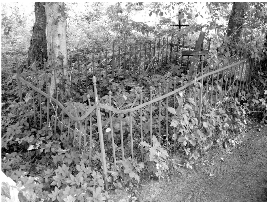
Ryc. 6. Cmentarz komunalny w Starym Krakowie. Mogiła rodzinna wygradzona metalowym kojcem.

ków. Cmentarz w części starszej (zachodniej) podzielony został aleją klonową z egzemplarzami obrosniętymi bluszczami. Czytelny jest układ alejowo-kwaterowy z dość licznie zachowanymi starymi nagrobkami i mogiłami z podziałem na pochówki dorosłych i dzieci. W tej części cmentarza znajdują się pochówki zmarłych nie tylko ze Starego Krakowa, ale także z Mazowa i Kanina. Wśród nich są nagrobki: z krzyżem żeliwnym krawca Braatza (1837–1892), wykonanym w odlewni Paula Stefena w Sławnie, fragment krzyża z nagrobka Mathilde Barske (1852–1920) i Agnes Drews z domu Lilitt (1911–1933). Większość nagrobków to formy popularne na Pomorzu – lastrykowe stele, nagrobki z krzyżem, z cokołami z wnęką, w której pierwotnie umieszczane były porcelitowe figurki aniołków (nagrobki dziecięce), nagrobki w formie płyty z motywem palmy, krzyża, pnia dębu itd. Istnieje również mogiła rodzinna z metalowym kojcem (ryc. 6). W zachodniej części cmentarza znajdują się także trzy pochówki z lat 50. XX wieku. Wszystkie nagrobki, podobnie jak drzewostan, obrosnięte są bluszczem. Wśród starodrzewia zachowane są: jesion, klon, dąb i świerk. W części wschodniej pochówki współczesne.