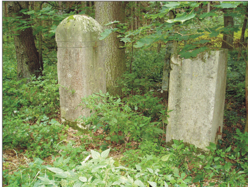
B. Żabno. Słupki bramne cmentarza.