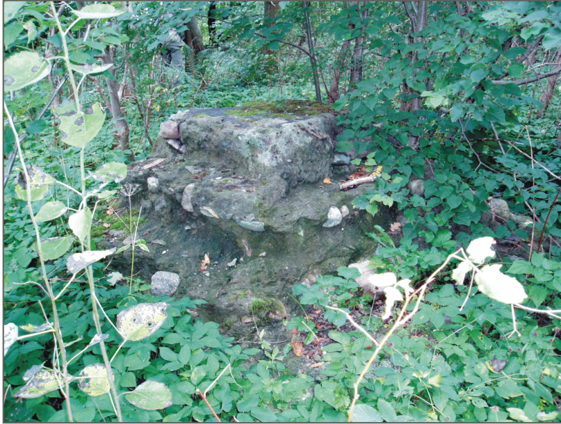
A. Warszkowo. Zachowany fragment cokołu z pomnika poległych.