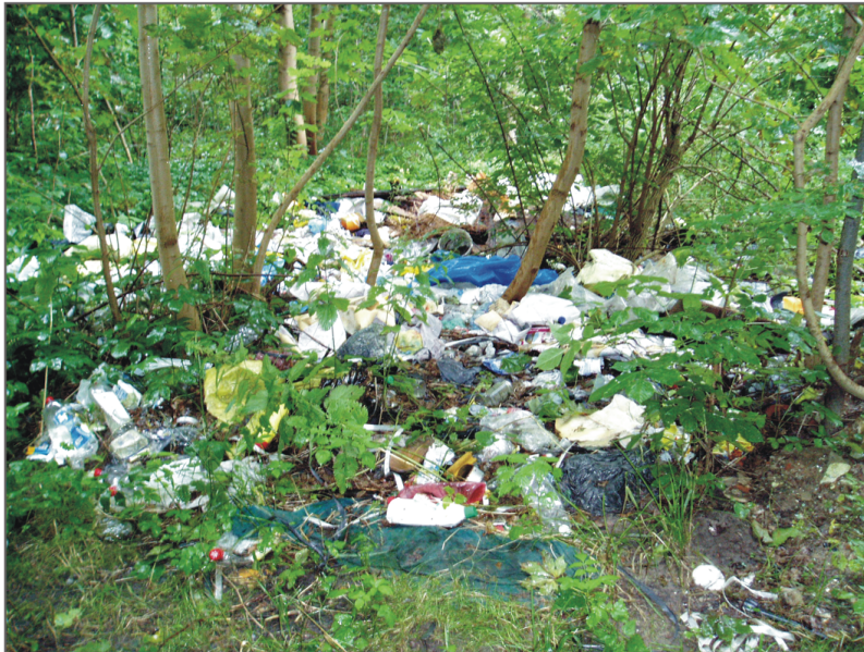
A. Tokary. Wysypisko śmieci na granicy dawnego cmentarza ewangelickiego. Fot. K. Kontowski, 2007